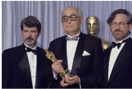
▲ 左から ジョージ・ルーカス、黒澤明、スティーブン・スピルバーグ

すごい。《「不平」「希望」ご遠慮なく申し出てください》が『生きる』の舞台の市民課窓口の張り紙。世田谷区役所でも15年ほど前に《すぐやる課》が登場。窓口に立つと全員が気づかぬフリ。「こんちわ」と言うコンピュータ画面にくっつくほど顔を寄せ聞こえぬフリ。会社だったら半日で倒産する運営形態だが極めて安定経営。《すぐやる課》の存在で、他の課は《すぐしない課＝何もしない課》の証明なのかわからないどころか《すぐやる課》を誇りにしている助役。丸亀市役所の部長たちは近くにある丸亀城内の資料館のソファでサボる。会議机上では仰向けに寝そべてタバコにマンガ本。吸殻入れのコーヒー缶は何ヶ月も会議室に置いたまま。全館禁煙だが議員どもはタバコ吸い放題で、あげくは女性職員に片付けさせる。職員はくわえタバコに自転車市内をフラフラ。着任した教育長は「教師が快適に過ごせるよう」と言い放ち「生徒のため」じゃない。決して挨拶をしない教委のオバさんは幼稚園園長に就任。新人ば無事退職金をいただけるように38年間勤めます」と挨拶。高校教師は自転車泥棒。「気が利かず世間知らずで無愛想。私が市民に笑顔で接すると「過剰サービスだ」と文句を言う」と県の観光連盟で働いた人。「高校の教頭は昼寝が日課で、よく外で汚い足の爪を切った」「生徒のシャツやソックスの色や髪の毛を細かくチェックしてキーキー、ヒステリーの中学の生徒指導教師は、自分は似合わないピンクのミニスカートにベタベタ化粧に大きなイヤリング、ネックレス、ブレスレット、マニキュア」「カナダに留学したい」と言ったら、先生は「留学して成功した奴はいないぞ」と怒った」と学生...等々。これらの一目瞭然の腐りぶりは全職員が知っているはずなのに、同じ穴のムジナ共は「いや、いい人だっている！」とムキになる。社会悪を見て見ぬフリする「いい人」がいるという理論を貫く寄生虫たち。汗、涙を流す市民側の体験なしに「市民のために尽くす」なんて、ちゃんちゃらおかしい。